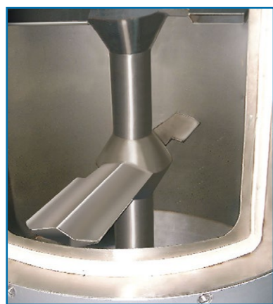
Particolare degli aspi rotanti Rotating reels Aspas rotativas en particular

Cristalizadores con un concepto novedoso que permite la cristalización de PET EN CONTINUO, aún con material molido o en pequeñas cantidades. El aire pasa a través del eje central y se distribuye uniformemente a los diferentes niveles de la tolva gracias a las huecas aspas difusoras. No se requiere parar el proceso de producción para la limpieza del difusor de aire caliente. Además de que sin el uso de filtros de gran tamaño se pueden combinar con el deshumidificador. Su funcionamiento es completamente automático y es controlado por medio de un microprocesador que maneja completamente el proceso de cristalización sin que exista la necesidad de un operador, comparando la temperatura del aire con los amperes absorbidos por las aspas del motor.